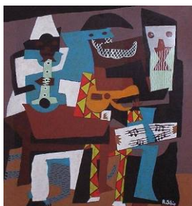
Pablo PICASSO I tre musicisti , 1921