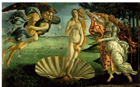
Sandro BOTTICELLI Nascita di Venere , circa 1482-85